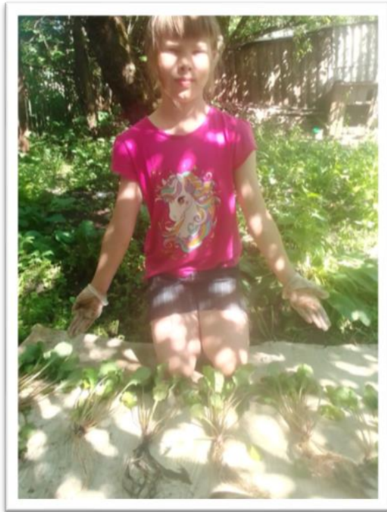
Фото4. Деление куста