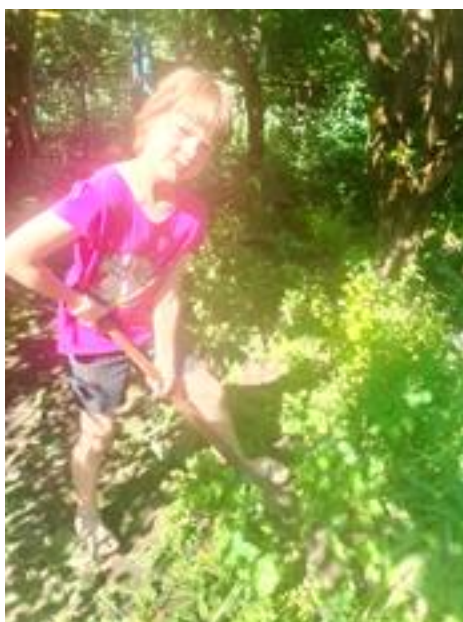
Фото 3 Выкапывание куста