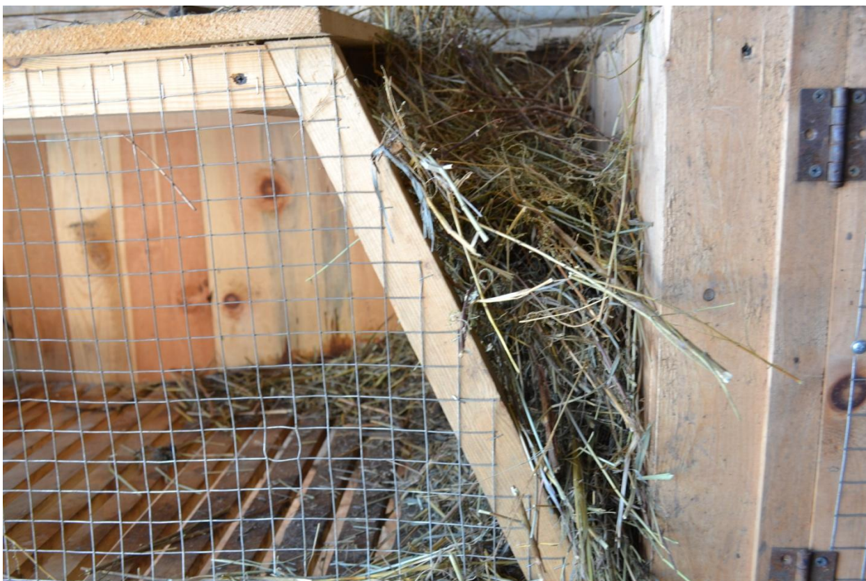
Приложение № 11.