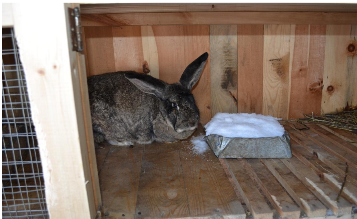
Емкость для дачи воды и снега.