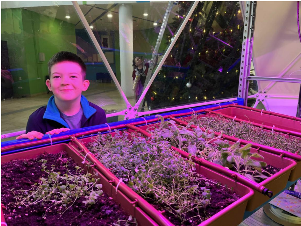
Фото 5. Система рассчитана на полив 6 контейнеров с двух сторон.