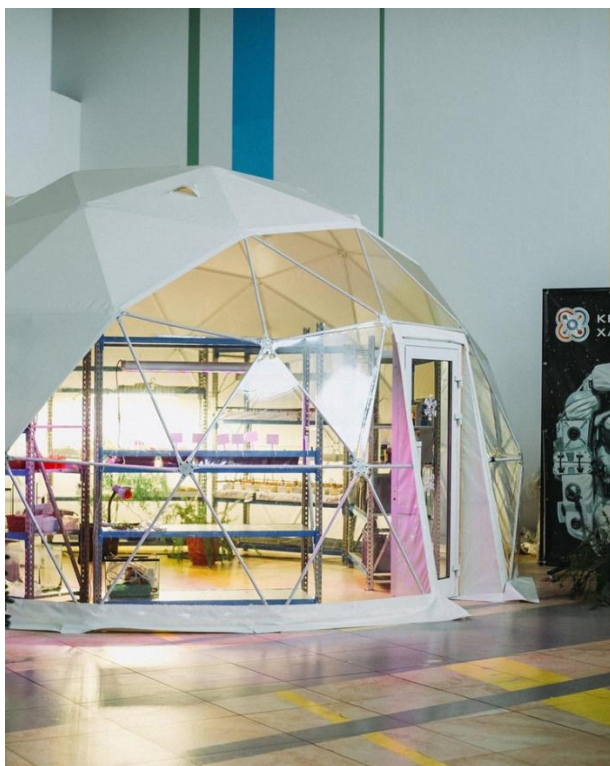
Фото 1. Теплица ДТ «Кванториум»