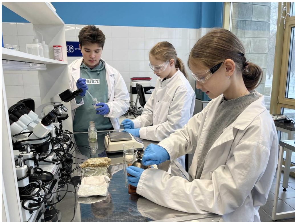
Фото 7. Создание косметического средства