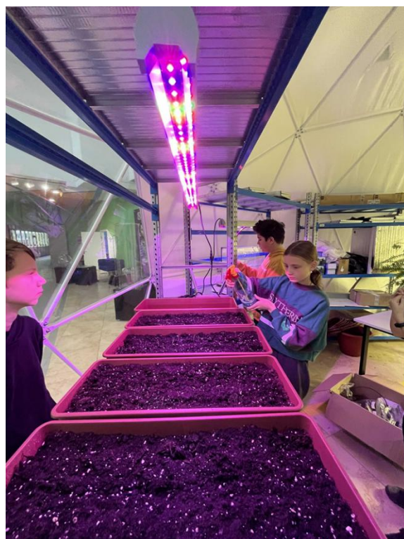
Фото 2. Посадка лекарственных трав