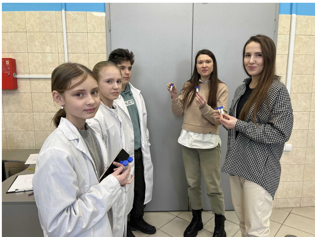
Фото 8. Тестирование продукта на фокус-группе, в которую вошли методисты ДТ «Кванториум «Хакасия»