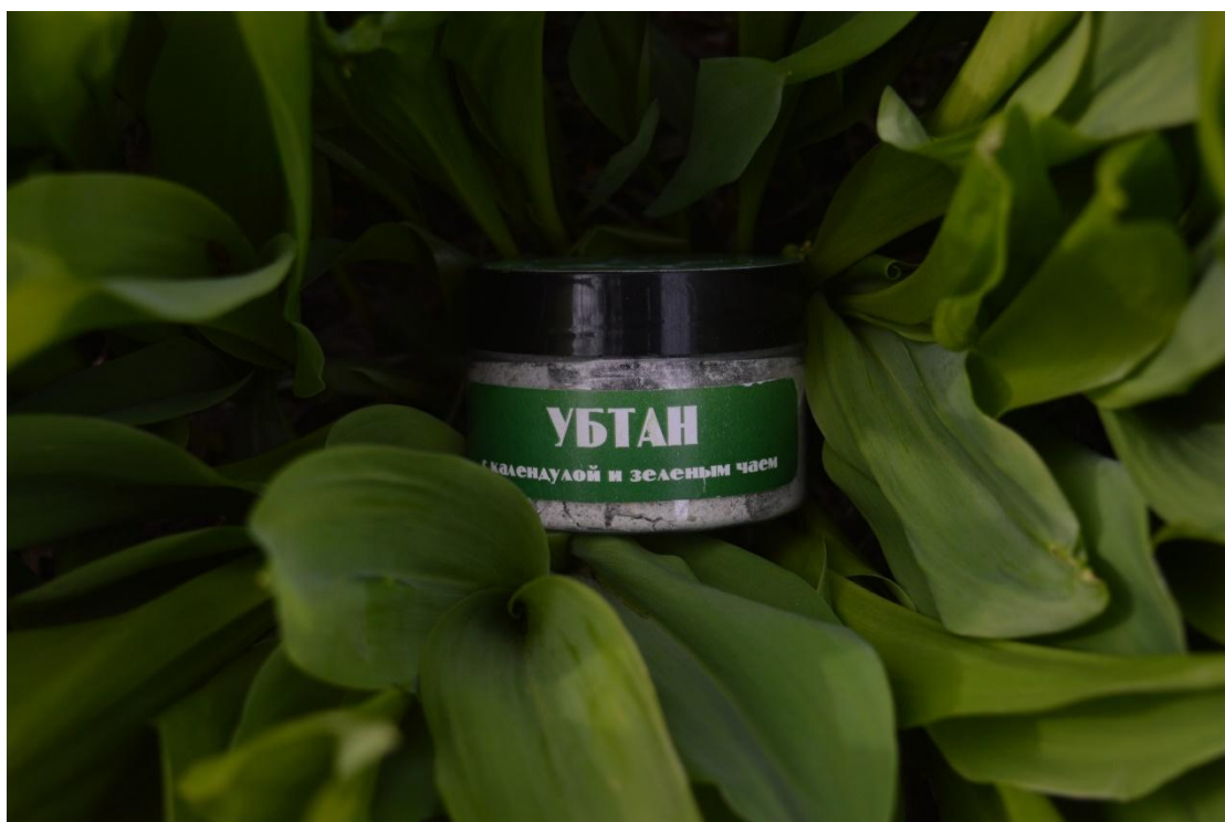
Фото 10. Рекламная съемка продукта