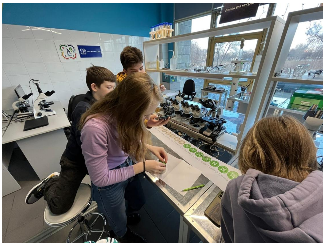
Фото 9. Упаковка продукта