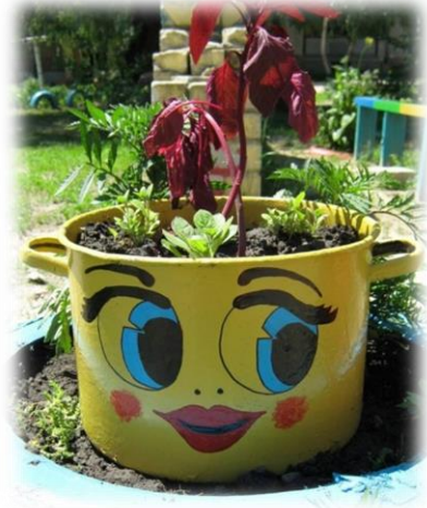
Фото 10, 11, 12 Вторая жизнь старых вещей