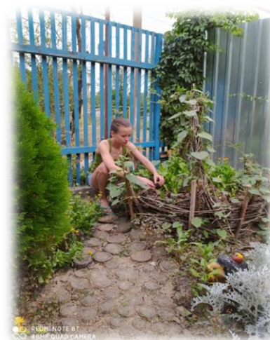
Фото 1, 2 Устройство клумбы.