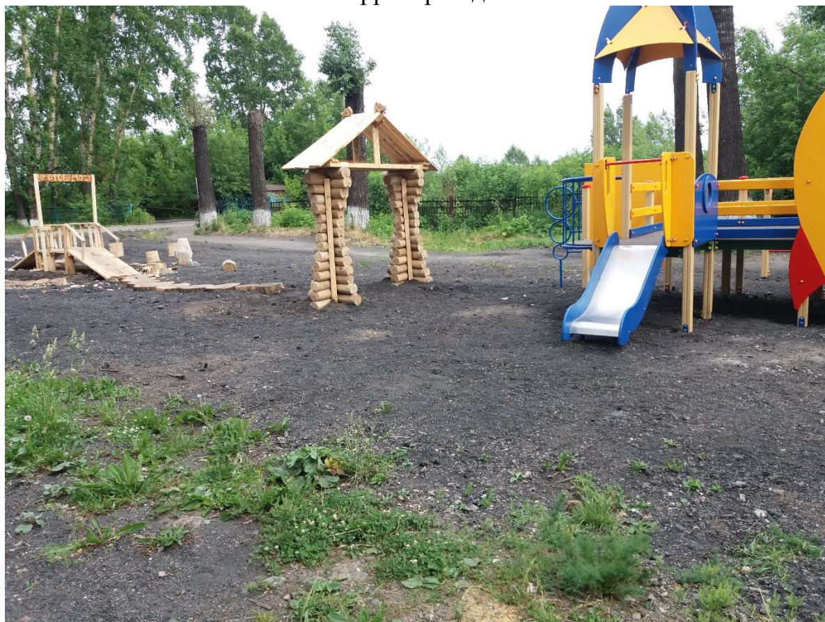
Фото территории до озеленения