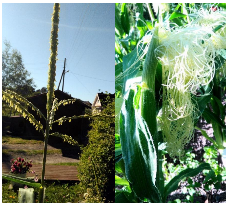
Рис.6. Цветение кукурузы (мужские цветы – метёлки и женские цветы в виде нитей)

Критическими периодами в формировании высокого урожая на данном этапе развития являются фаза 2-3 листьев, когда происходит дифференциация зачаточного стебля, и фаза 6-7 листьев, когда определяется размер початка. Этот период длился с 23 апреля по 1 июня.