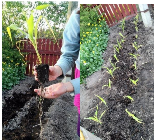
Рис.3. Высаженная в грунт кукуруза

Всего было высажено по 16 растений каждого сорта. Рассада не укрывалась, так как стояла тёплая погода.