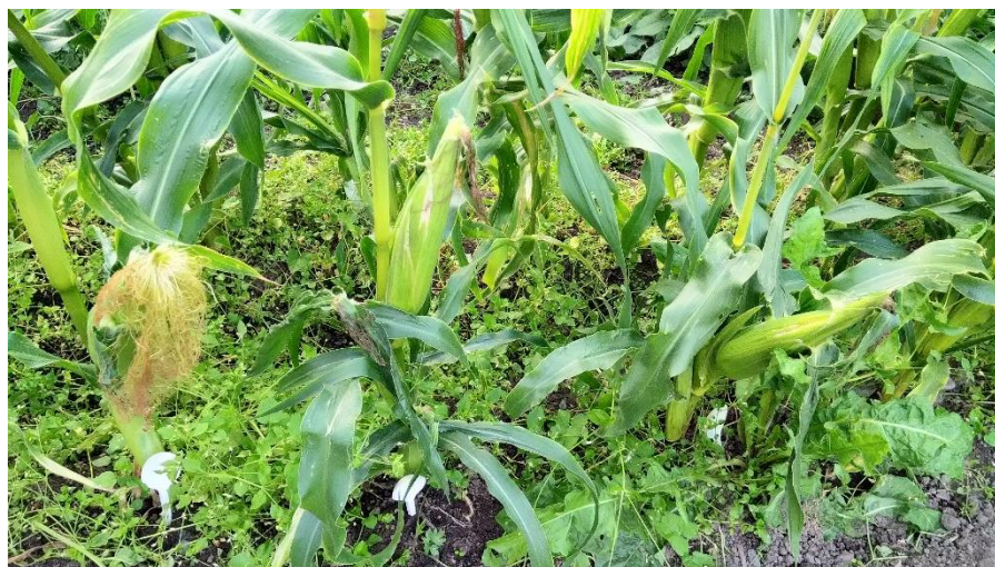
Рис. 7. Время активного роста початков.

В целом, общая продолжительность развития и созревания кукурузы обоих сортов составила 133 дня, что не совпадает с литературными данными изучаемых сортов. Вероятно, это связано с температурными характеристиками лета.