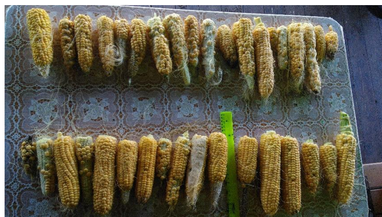
Рис.8. Початки кукурузы разных сортов.

Однако на момент уборки урожая часть початков сгнила и только 19 початков у «Лакомки» и 17 у сорта «Золотой батам» оказались в хорошем состоянии (рис.8.).