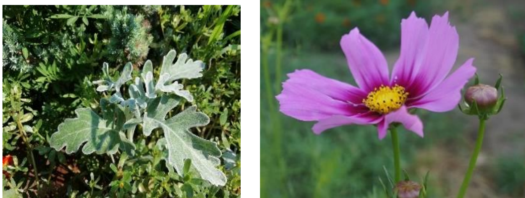
Рисунок 15 – Космея Морская раковина; Цинерария Алмазная пудра

Солнцелюбивый многолетник с красивой, резной, серебристо-пепельной листвой, которая на протяжении всего периода вегетации сохраняет свою декоративность. В высоту достигает 20 см.