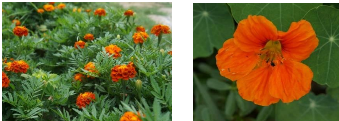
Рисунок 14 – Бархатцы Болеро; настурция Король Теодор

Настурция –цветущий однолетник или многолетник. Растение с голым, хрупким стеблем вырастает до 2,5 м. Некоторые сорта принимают форму куста высотой до 70 см. Округлые темно-зеленые листья растут на длинных черешках. В июне распускаются яркие цветы диаметром 5-6 см. Они имеют простую или махровую форму.