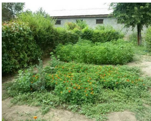
Рисунок 20 – Иерархичное увеличение высоты растений

Вдоль бордюра сделана прямоугольная рабатка длиной 13 м и шириной 2 м по краям которой высажены низкорослые растения, а в центре - высокорослые. В цветнике использовано несколько видов растений.