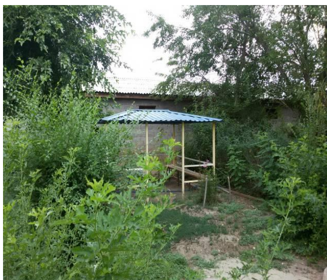
Рисунок 21 – Беседка.

В жаркие астраханские дни вы можете спрятаться в прохладной тени беседки (Рисунок 21), где вас порадуют своим видом экзотические растения с нежными цветами (Рисунок 22). Если же во время посещения нашего центра вас застала непогода, то вы можете с лёгкостью добраться до беседки, не испачкав обуви, так как у нас в дизайне предусмотрена декоративная дорожка из деревянных спилов.