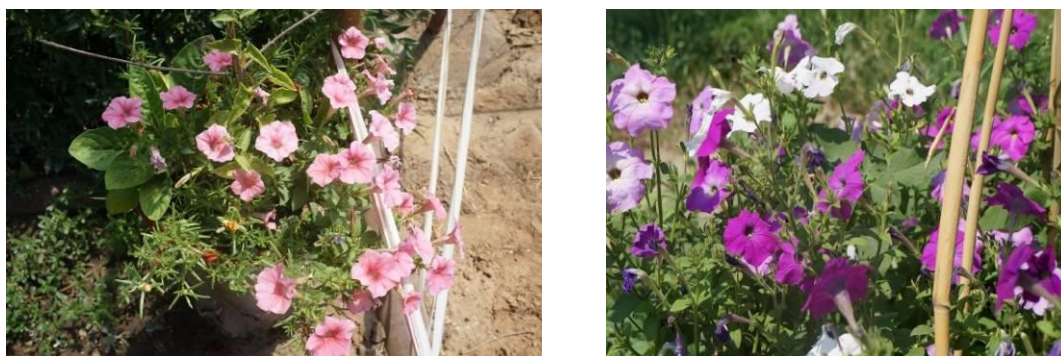
Рисунок 13 – Минитунни и петунии

куст, способный украсить любой сад или клумбу. Имеют красно-жёлтую расцветку с волнистыми лепестками-оборочками. Сорту обладает засухоустойчивостью, актуальной при засушливом климате.