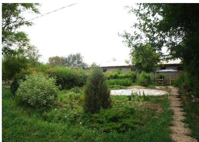
Рисунок 2 – Вид участка летом

Ландшафтн ы й дизайн - искусство, находящееся на стыке трёх направлений: с одной стороны, архитектуры, строительства и проектирования (инженерный аспект), с другой стороны, ботаники и растениеводства (биологический аспект) (Рисунок 2) и, с третьей стороны – в ландшафтном дизайне используются сведения из истории (особенно из истории культуры), философии и целого ряда технических наук. Кроме того, ландшафтн ы м дизайном называют практические действия по озеленению и благоустройству территорий (Устелимова С.В., 2003).