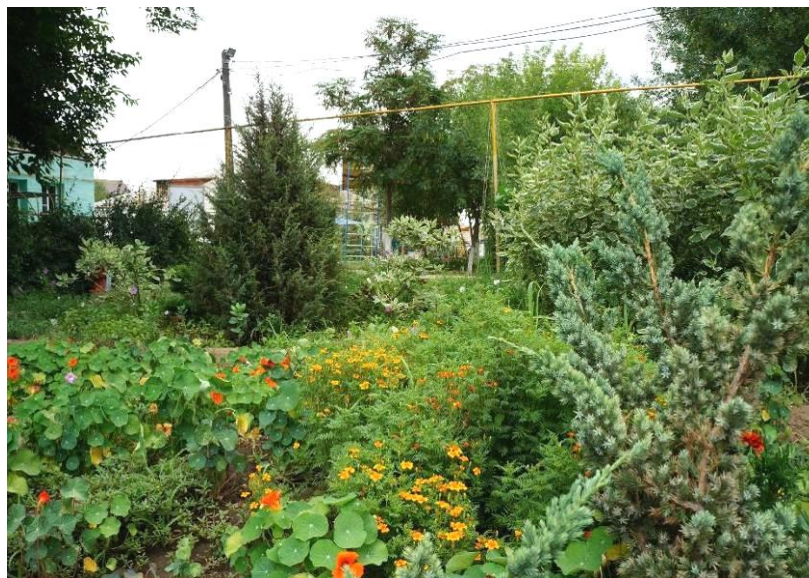
Рисунок 3 – Композиция посадки растений.

Такой принцип помог нам начать не с нуля, способствовал быстрой работе, за счет чего нами за короткий период был сформирован участок из густого букета цветов.