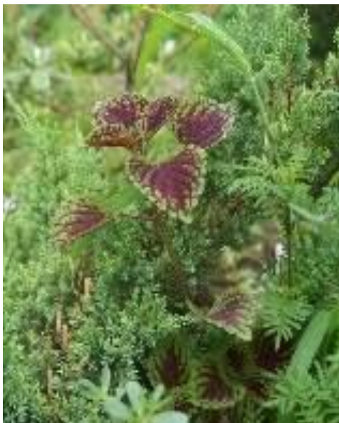
Рисунок 18 - Колеус Визард Скарлет

утренние часы. Второй способ используют при посадке растений, боящихся низких температур (Евтюхова М.А., 1968).