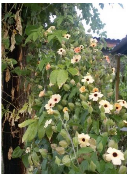
Рисунок 17 - Тунбергия Блашинг Сьюзи

В ландшафте может использоваться как элемент миксбордера либо для создания «цветовых пятен» и акцентов.