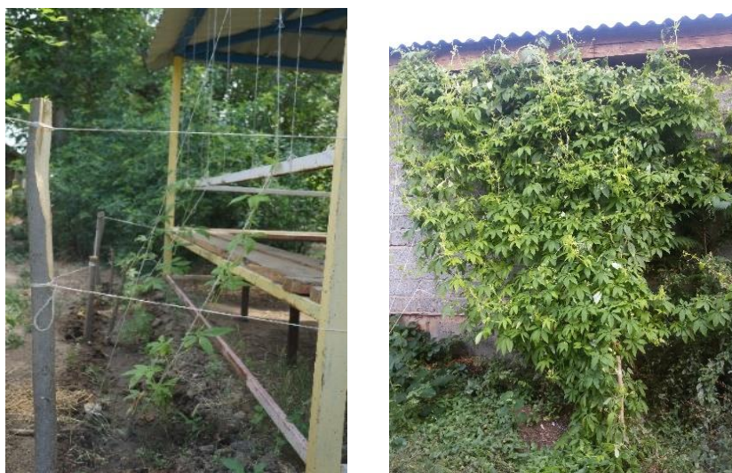
Рисунок 12 – Циклантера

Кроме питательных плодов, перуанский огурец имеет интересный декоративный вид и может украсить любое сооружение.