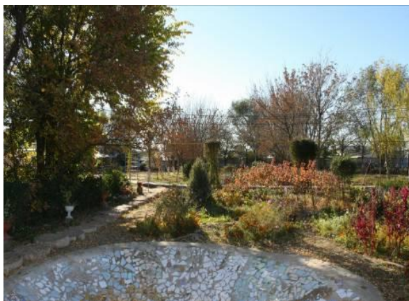
Рисунок 25 – Участок осенью

Зоны активного отдыха могут быть обширными и включать детские площадки с качелями и горкой (Ерлыкин Л. А., 1993), или весьма скромными и состоять из декоративных элементов, например, дорожки, оформленной в той или иной технике. Вдоль садовых дорожек нами была высажена рабатка.