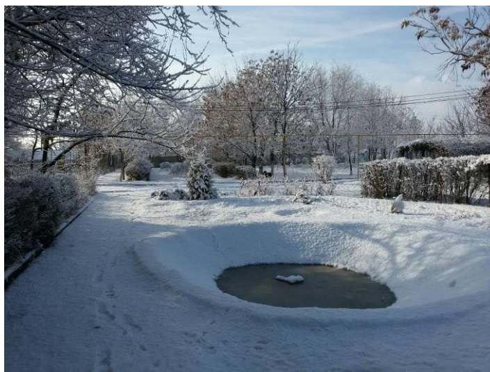
Рисунок 1 – Вид зимнего участка

Некоторые цвета имеют для человека специфическое значение и связаны, как правило, с определенными событиями в жизни. Но существуют и общие для всех закономерности цветового воздействия. Красный цвет, например, является физическим и психическим стимулятором. Глядя на зеленый цвет человек отдыхает телом и душой, а синий, в свою очередь, расслабляет и успокаивает (Устелимова С.В., 2003). Поэтому можно говорить, что чистота и пышность парковых зон, наполненных разноцветными бабочками и множеством разных животных, благотворно влияют на эмоциональное и физическое состояние человека. Свежий воздух, теплая погода так успокаивают и поднимают настроение! И конечно же, наслаждаться природой мы будем в городских скверах, которые нуждаются в постоянной чистоте, поливе и уходе (Рисунок 1), где кто-то будет спокойно гулять, заниматься спортом или рисовать.