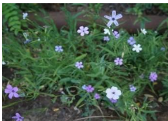
Рисунок 11 – Вискария Холидей

Цветы зелёных, малиновых, голубых, фиолетовых цветов. Высота растений составляет 25 сантиметров. Спустя всего четыре недели после высадки семян, растение ярко зацветает. Семена хорошо всходят при температуре от 18 до 20 градусов Цельсия. Важное участие для успешного цветения и развития вискарии – это наличие солнечного тепла и света, а почвы могут быть самыми различными.