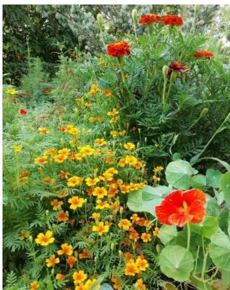
Рисунок 8 – Растения, посаженные рассадой

Семена приобретались нами либо в интернет магазине, либо использовались из частных запасов. Посадку осуществляли частично в теплицах на территории центра с дальнейшей пересадкой рассады (Рисунок 8) в открытый грунт на участок или засеивали растения сразу в грядки, если особых никаких особых условий по выращиванию не было указано в инструкции к посадке.