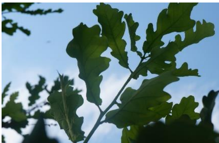
Рисунок 5 – Фотография листьев дуба в летнее время года

– размещение малых архитектурных форм и средств визуальной ориентации (средства информации и визуальной ориентации призваны обеспечить рациональное распределение информации, создания визуальных акцентов для ориентации человека в пространстве. Малые архитектурные формы, как неотъемлемый компонент преобразованного ландшафта, призваны создать необходимый уровень комфортности в местах пребывания людей в городских пространствах).