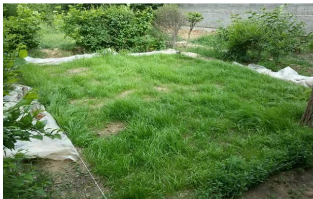
Рисунок 16 – Газон Солнечная долина

Блашинг Сьюзи следует пересадить на постоянное место. Солнцелюбивая, плохо переносит заморозки.