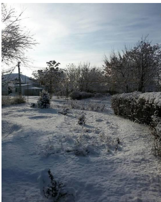
Рисунок 4 – Вид участка зимой

Такой принцип помог нам начать не с нуля, способствовал быстрой работе, за счет чего нами за короткий период был сформирован участок из густого букета цветов.