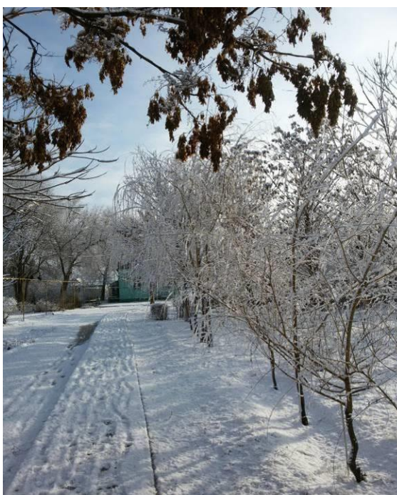
Рисунок 26 – Зима.

Летом в нашем небольшом парке появилась возможность укрыться от палящего солнца в беседке, осенью - собрать обширный гербарий, зимой (Рисунок 26) - полюбоваться заснеженным пейзажем, а весной увидеть, как распускаются ароматные цветы и послушать пение птиц.