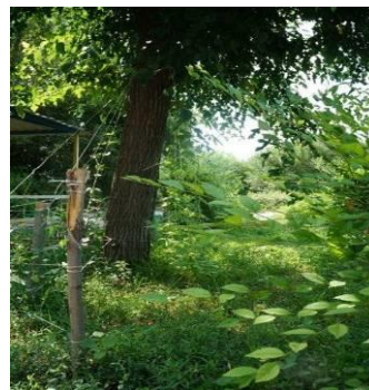
Риснок 22 – Результаты работы