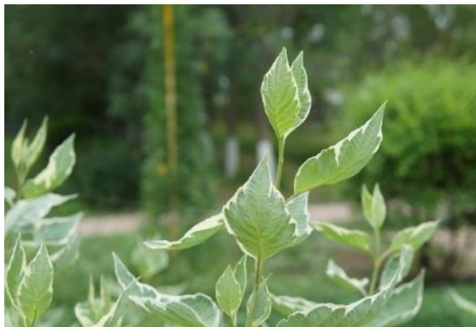
Рисунок 9 - Дерен белый Сибирика

Выполняет функцию живой изгороди, ограждения. Одновременно служит фоном для травянистых декоративных растений. В силу своей природы, такой элемент композиции обладает рядом недостатков: нуждается в ежегодной обрезке, обедняет почву, поглощая из нее все питательные вещества, что отрицательно сказывается на близрастущих культурах.