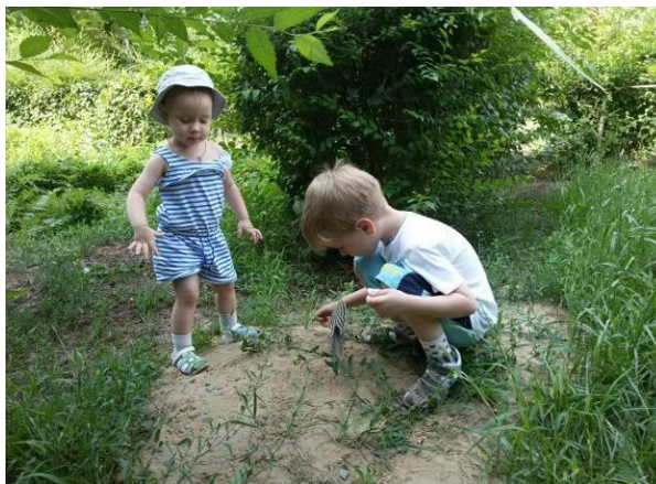
Рисунок 23 – Юннаты

Нашим маленьким посетителям мы предлагаем место для активных игр (Рисунки 23, 24) вдоль нежно розовых, фиолетовых цветов и бассейна. Для предотвращения разрушения этого гидротехнического сооружения была изготовлена пластиковая вставка из полиэтилена. Бассейн (Рисунок 25) занимает около 1/6 территории, что не уменьшает площадь участка в глазах смотрящего, а наоборот, придает объем и масштабность проекту. Диаметр бассейна составляет 5 м. В настоящее время проводится работы по реконструкции ложа водного объекта. В ближайшем будущем мы планируем запустить туда рыбу и черепах.