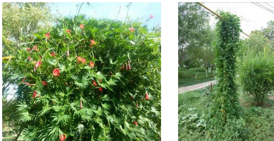
Рисунок 10 – Ипомея

Ипомея затеняет от солнца открытые беседки и веранды. Очень декоративно смотрится лиана, посаженная возле фонарей, стилизованных под старину. Распространена посадка растения для декорирования стен высоких зданий и одноэтажных садовых построек.