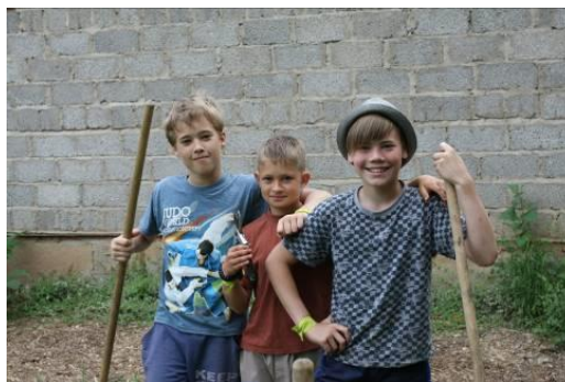
Рисунок 24 – Школьники – участники проекта «Экоград»