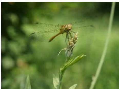
Рисунок 19 – Снимок стрекозы

Ручной садовый инвентарь с годами не теряет своей актуальности, скорее наоборот становятся более надежными и эргономичными (Florineth F.O., 2004). В ухоженном саду, наполненном насекомыми (Рисунок 19), где постоянный полив, своевременные обрезка кустарников и прополка сорняков, всегда необходимы инструменты, которые используются еще с древних времен - грабли с повернутыми и прямыми зубьями, тяпки, садовые тележки, секаторы, шланги, лейки и т.д.